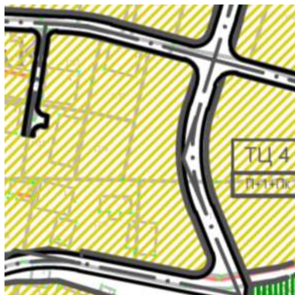
Извод из ППР-намена