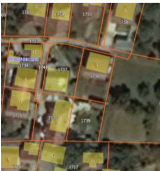
Извод из ГеоСрбије

Правила грађења се утврђују на основу Плана генералне регулације насеља Владичин Хан („Сл. гласник Града Враћа број 11/2021), по коме се предметна парцела налази у зони 10 – Полом, ТЦ 4 – стамбени блокови дефинисани нерегулисаном и неправилном матрицом саобраћајница, чије су трасе условљене неповољном конфигурацијом терена.