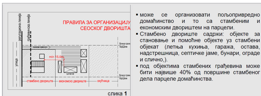
За стамбене зграде пољопривредног домаћинства: