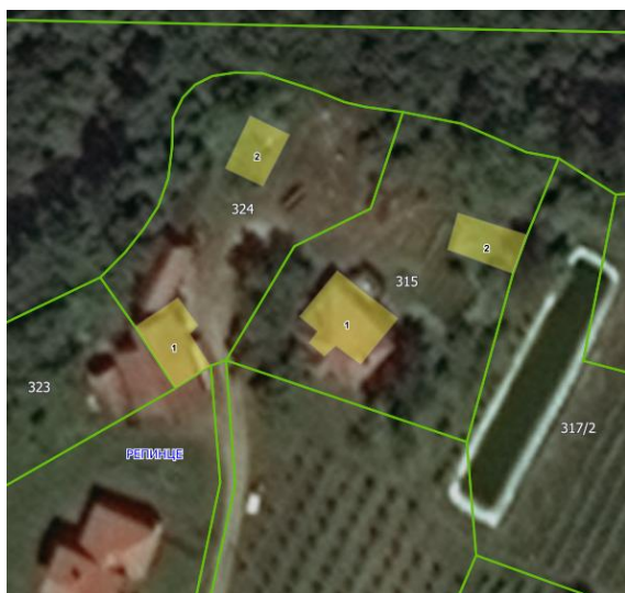
Извод из ГеоСрбије

Катастарске парцеле број 324 и 315 обе КО Прекодолце за које се издају локацијски услови налазе се у селу Репинце, Општина Владичин Хан које представља развијеније и популационо веће сеоско насеље. Предметна локација излази директно на кп.бр. 334 КО Репинце (некатегорисани пут) преко кп.бр. 324 КО Репинце.