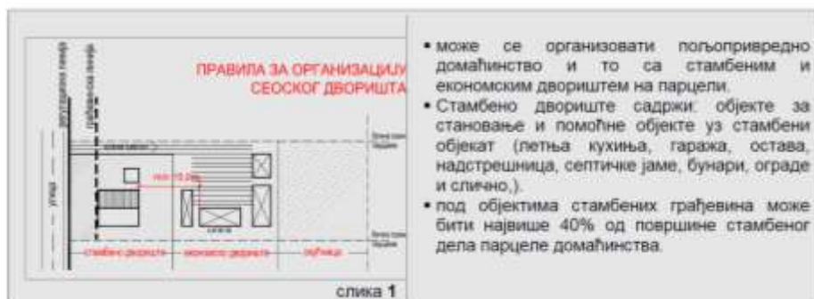
За стамбене зграде пољопривредног домаћинства: