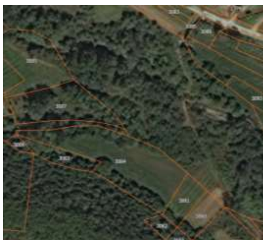
Извод из ГеоСрбије

Катастарске парцеле број 3061 и 3062 обе КО Лепеница за које се издају локацијски услови налазе се у селу Лепеница, Општина Владичин Хан које представља локални центар са развијеним примарним сектором. Предметна локација излази посредно на кп.бр. 3085 КО Лепеница (некатегорисани пут) а преко кп.бр. 1387/1 КО Лепеница – сезонски пут кроз речиште Лепеначке реке.