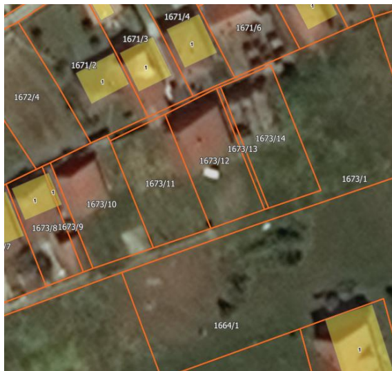
Извод из ГеоСрбије

Катастарска парцела број 1673/14 КО Прекодолце за коју се издају локацијски услови налази се у селу Прекодолце, Општина Владичин Хан које представља субопштински центар са развијеним секундарним и терцијарним сектором. Предметна парцела може посредно преко кп.бр. 1673/1 КО Прекодолце изаћи на кп.бр. 1674 КО Прекодолце која је означена као некатегорисани пут изграђен пре доношења прописа.