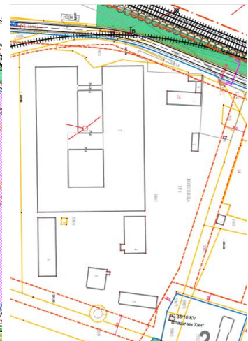
Извод из ГеоСрбије и ПДР Индустријска зона Владичин Хан