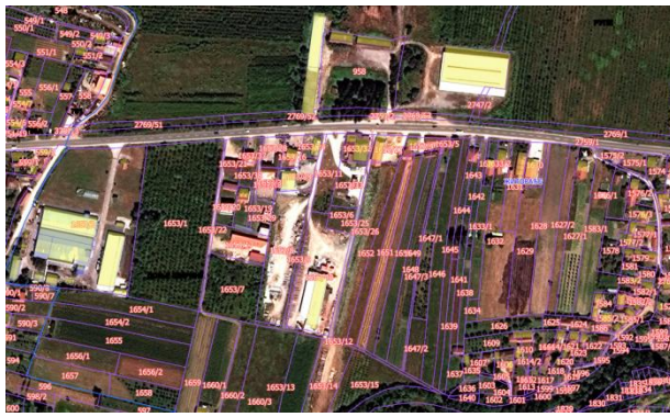
Извод из ГеоСрбије