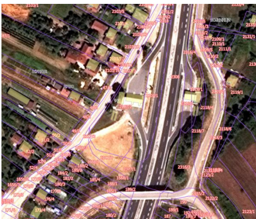
Извод из ГеоСрбије

Катастарска парцела број 2107/2 КО Полом за коју се издају локацијски услови налази се у селу Полом-Општина Владичин Хан које представља развијеније и популационо веће насеље и имаће директан приступ на кп.бр. 2107/1 КО Полом која једним делом представља државни пут првог А реда бр. 1А, а што ће бити предмет другог пројекта и у надлежности је другог органа.