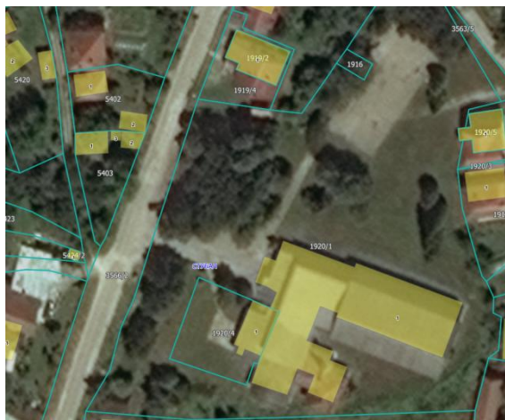
Извод из ГеоСрбије

Парцеле за које се издају локацијски услови налазе се у селу Стубал-Општина Владичин Хан које представља субопштински центар са развијеним секундарним и терцијарним сектором и имају директан-посредан приступ на кп.бр. 3566/2 КО Стубал која представља пут у својини Општине Владичин Хан-грађен пре доношења прописа.