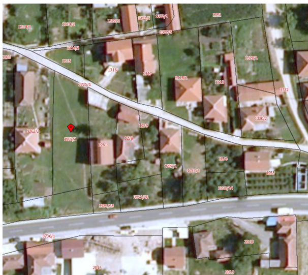
Извод из КТП-а

Катастарска парцела број 1262/1 КО Прекодолце за коју се издају локацијски услови налази се у селу Прекодолце, Општина Владичин Хан које представља субопштински центар са развијеним секундарним и терцијарним сектором. Предметна парцела излази на кп.бр. 3735/1 КО Владичин Хан која је у вези са кп.бр. 3732 КО Прекодолце-Просторним планом намењена за општински пут.