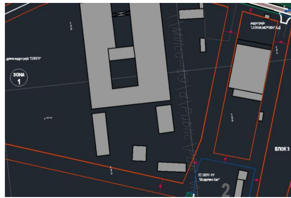
Извод из ПЦР