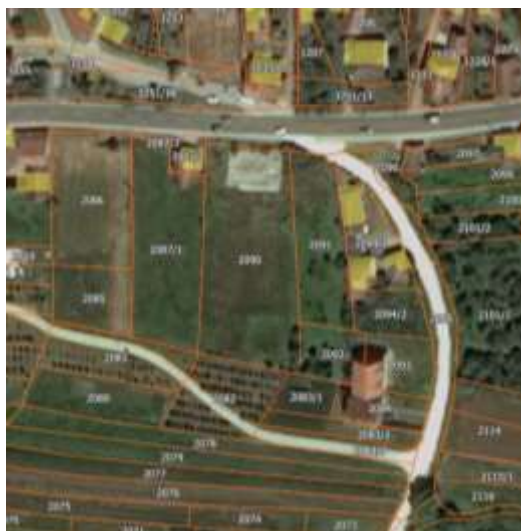
Извод из ГеоСрбије

Катастарска парцела број 2091 КО Прекодолце за коју се издају локацијски услови налази се у селу Прекодолце, Општина Владичин Хан које представља субопштински центар са развијеним секундарним и терцијарним сектором. Предметна парцела директно излази на кп.бр. 2095 КО Прекодолце која је означена као некатегорисани пут изграђен пре доношења прописа те може испунити услов за грађевинску парцелу.