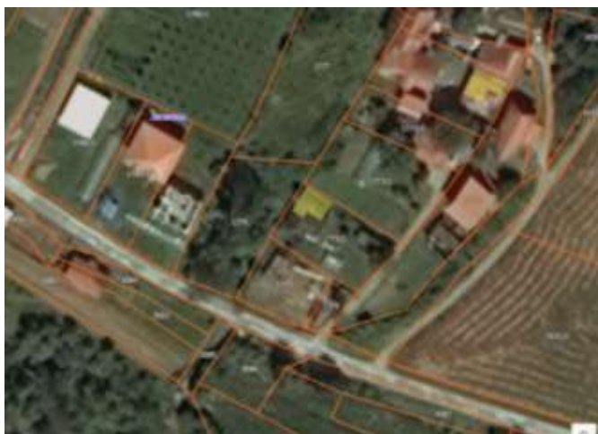
Извод из ГеоСрбије

Катастарска парцела број 1780/2 КО Лепеница за коју се издају локацијски услови налази се у селу Лепеница, Општина Владичин Хан које представља локални центар са развијеним примарним сектором. Предметна парцела је у директој вези са државним путем другог реда (дп 124а), те ће посредно преко кп.бр. 1780/1, 1777, 1773/1 и 1772 све КО Лепеница изаћи на кп.бр. 1633 КО Лепеница која је означена као некатегорисани пут изграђен пре доношења прописа.