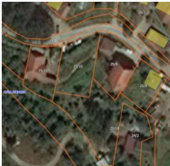
Извод из ГеоСрбије

Катастарска парцела број 25/10 КО Сува Морава за коју се издају локацијски услови налази се у селу Сува Морава, Општина Владичин Хан које представља развијеније и популационо веће насеље.