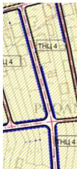
Извод из ППР-намена

Правила грађења која важе за предметну локацију су: